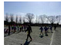
5年タグラグビー教室