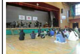
妻沼東中学校吹奏楽部による音楽鑑賞会