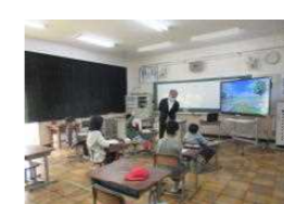
なかよし授業参観