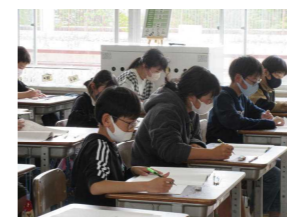
全国学力・学習状況調査